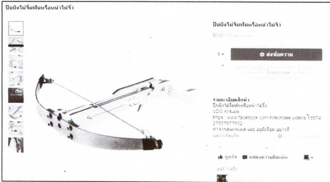
ภาพที่ ๒ การจำหน่ายของเล่นประเภทหน้าไม้จิวผ่านทางเว็บไซต์ hitech-dee.com

๑.๓ สืบค้นข้อมูลการจำหน่ายของเล่นประเภทหน้าไม้จิวในประเทศไทย พบว่า มีการจำหน่ายผ่านเว็บไซต์ hitech-dee.com และสื่อออนไลน์เฟซบุ๊กชื่อ hitechdee โดยระบุรายละเอียดสินค้าว่าทำจากวัสดุประเภทสแตนเลส และอลูมิเนียมอย่างดี โดยสามารถใช้ไม้จิ้มฟันในการยิงไปยังเป้าต่างๆ และสามารถยิงได้ไกลถึง ๗ เมตร ราคา ๕๙๐ บาท (รายละเอียดดังภาพที่ ๒) และนอกจากนี้ ยังมีการนำเสนอเป็นคลิปวิดีโอทดสอบการยิงหน้าไม้จิว ผ่านสื่อออนไลน์เฟซบุ๊กชื่อ hitechdee ซึ่งมีการใช้หน้าไม้จิวและไม้จิ้มฟันแทนลูกดอกในการยิงไปยังฝัก ผลไม้ รวม ๓ ชนิด ได้แก่ แครอท หัวไชเท้า และแก้วมังกร ผลปรากฏว่า สามารถยิงและฝังติดกับเนื้อของผลไม้ดังกล่าวได้ (รายละเอียดดังภาพที่ ๓)