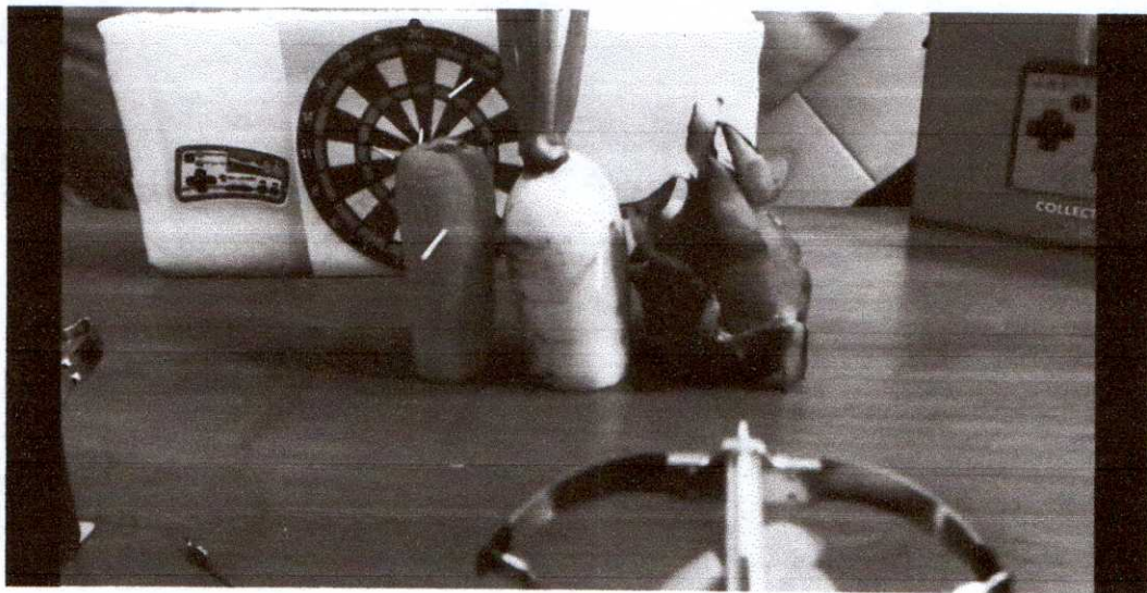
ภาพที่ ๓ ทดสอบการยิงหน้าไม้จิวด้วยไม้จิ้มฟัน ไปยังฝัก ผลไม้ รวม ๓ ชนิด ได้แก่ แครอท หัวไชเท้า และแก้วมังกร