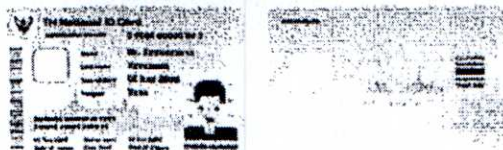
(ตัวอย่างบัตร)

2. นำบัตรประชาชนไปที่ ธนาคาร/จุดบริการ ใกล้บ้านท่าน